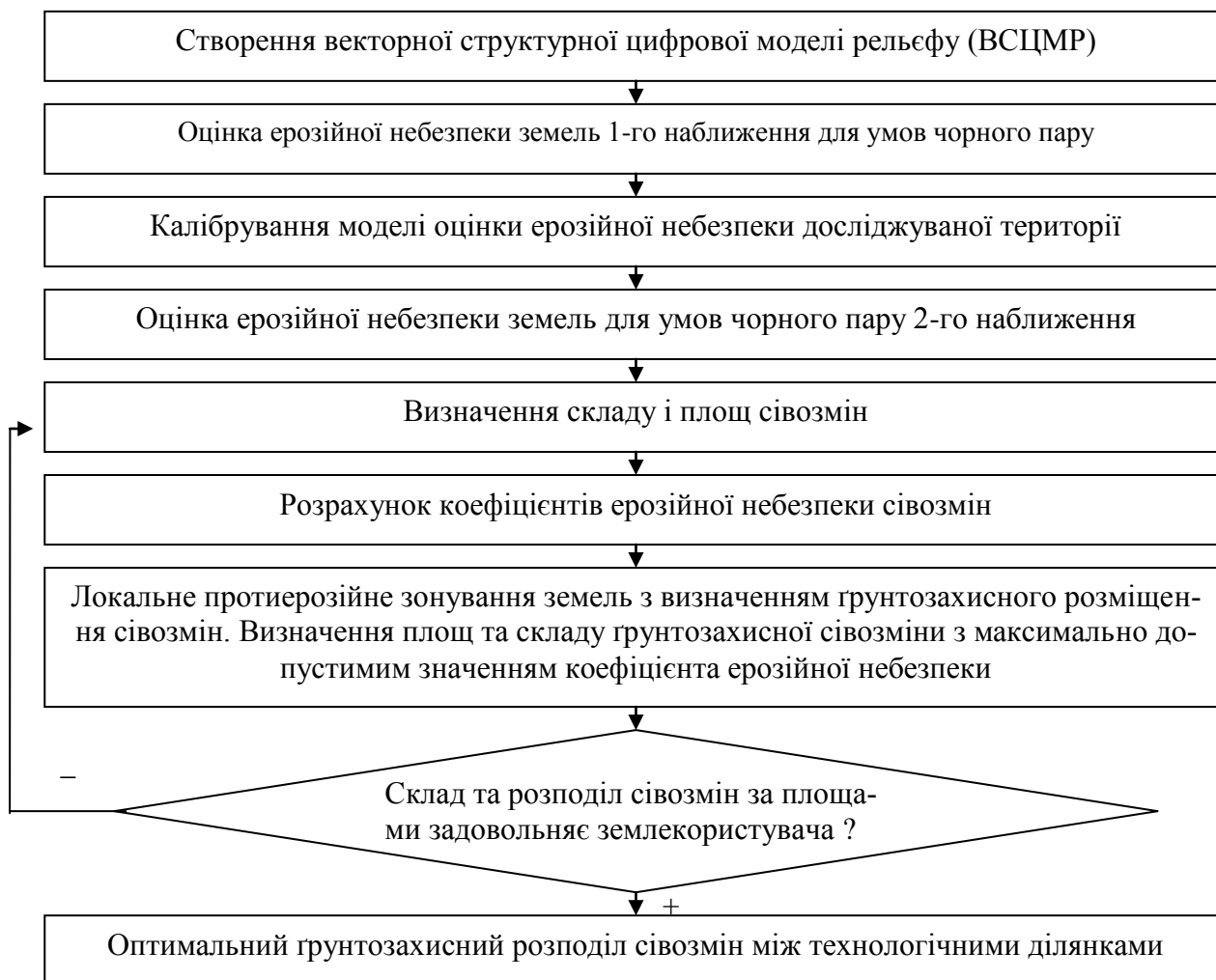
Рис. 1 – Послідовність мінімізації ризику ерозії за рахунок використання ґрунтозахисних властивостей сільськогосподарських культур

Для ерозійно-безпечного впорядкування сівозмін у просторі необхідно провести локальне протиерозійне зонування земель [12]. Для цього, за довідковими даними, розраховують значення коефіцієнта ерозійної небезпеки для кожної сільськогосподарської культури, які наведено в таблиці 1 [13]. Протиерозійне зонування земель здійснюють шляхом креслення у